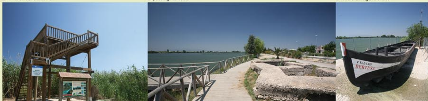
El restaurant llagut Dertusa