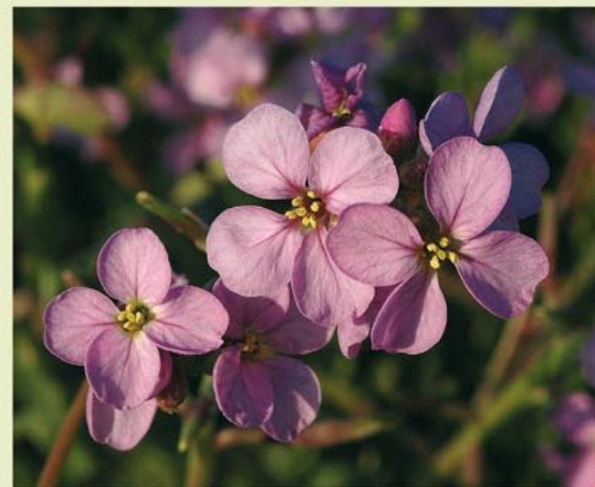
El rave de mar ( Cakile maritima ) és molt present a la zona dunar de Riumar.

costats del camí. Trobarem un encreuament i girarem a l'esquerra (km 3,6) en direcció a Deltebre i el Parc Natural del delta de l'Ebre. Envoltats d'arrossars arribarem a un encreuament amb la carretera TV-3454 (km 5,5). Hem de continuar a l'esquerra per la carretera agrícola asfaltada, a la dreta tindrem el canal de l'Esquerra de l'Ebre. Compte amb els vehicles agrícoles, sobretot en temporada de sega de l'arròs!