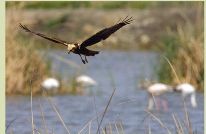
Una capadella ( Circus aeruginosus ), buscant una presa a la zona del Garxal.