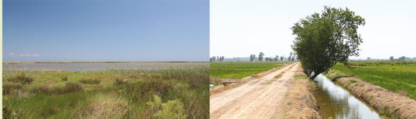
La llacuna del Garxal.

Continuant pel mateix camí, fins arribar prop de "la Casilla" (km 7,1) en un encreuament amb la carretera TV-3454, en el que hem de prendre les màximes precaucions, ja que hi ha molt trànsit. Hem de creuar per darrera de la casa, i travessar un petit pont sobre el canal.