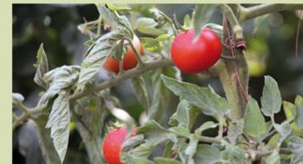
Sens dubte els millors conreus d'horta de totes les Terres de l'Ebre, són a l'Aldea.