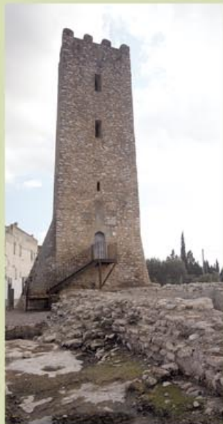
La torre de l'Aldea, amb el jaciment arqueològic del castell a primer terme.

tats del camí. Al final girarem a la dreta (km 3,6) on trobarem l'Ermida i la torre de l'Aldea, on hi ha el Centre d'Interpretació de la Torre. Per visitar-la s'ha de concertar vista amb l'oficina d'informació de l'Ajuntament. Llegiu i seguïu les indicacions dels plafons informatius que hi ha a l'entorn de la Torre. Continuarem fins la sinia que hi ha al costat de l'Ermida i girarem a la dreta pel camí asfaltat. En el següent encreuament (km 4,4), s'ha de continuar a l'esquerra, pel camí del Mas de Bernis, espectacular allotjament rural recentment restaurat. Continuant pel mateix camí, tot envoltats de conreus