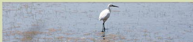
En l'arrossar recent sembrat, un martinet blanc s'endinça entremig dels brots d'arròs.