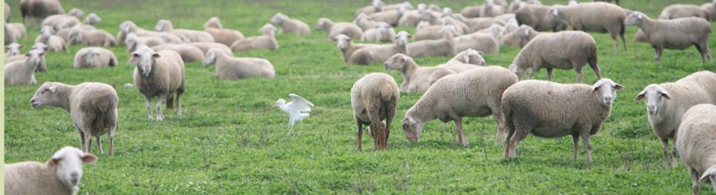
En l'itinerari també trobem prats de pastura, com era habitual al Delta abans de l'introducció del cultiu de l'arròs.