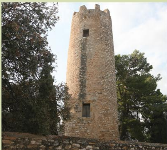
La torre de Burjassénia, des d'el camí que ens porta a la torre de la Candela.

Iniciem el recorregut a l'estació de tren de l'Aldea (km 0) i continuem cap a l'esquerra pel camí asfaltat. Seguint els senyals arribarem al poble (km 1,5), on caldrà creuar la carretera N-340 pel semàfor. Compte amb els vehicles! Seguirem els senyals que ens indiquen cap a l'Ermida i la torre de l'Aldea. A la sortida del poble, a la dreta, hi trobem uns magatzems d'arròs, i a l'esquerra els darrers conreus de garrofers i oliveres d'aquesta zona. Arribem al pont del canal de Camarles (km 2,2) i continuem recte fins arribar a un tram amb plataners en ambdós cos-