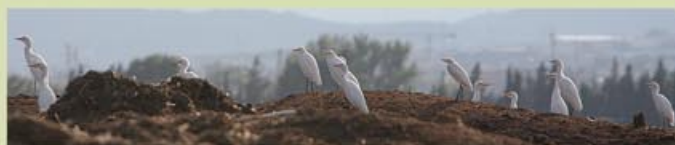
Els esplugabous, que ens acompanyaran en tot l'itinerari, es deixen fotografiar fàcilment.

d'horta i arossars, arribarem fins a un pont sobre el canal. El creuem i continuem recte pel camí que ens portarà, sempre recte, fins la torre de Burjassénia (km 6,6). Des de la torre tornarem pel camí senyalitzat fins arribar un altre cop al canal de Camarles (km 7,5), passarem el pont i, girant a la dreta, pel camí vora el canal fins arribar al senyal (km 8,5) que ens indica girar a la dreta. Aproximadament a 250 metres trobarem el final de l'itinerari des d'on podrem observar la torre de la Candela a l'altra part de la carretera N-340. Aquest itinerari transcorre per camins rurals i per carrils bici. Tot i la baixa densitat de vehicles, cal estar atents, principalment a les cruïlles. Atenció també al creuar la N-340, dintre el casc urbà de l'Aldea, encara que hi ha un semàfor regulador.