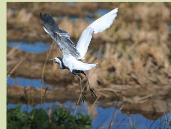
Un esplugabou s'enlaira vora un arrossar recent segat.