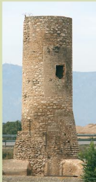
Torre de la Candela, al final de l'itinerari

d'horta i arossars, arribarem fins a un pont sobre el canal. El creuem i continuem recte pel camí que ens portarà, sempre recte, fins la torre de Burjassénia (km 6,6). Des de la torre tornarem pel camí senyalitzat fins arribar un altre cop al canal de Camarles (km 7,5), passarem el pont i, girant a la dreta, pel camí vora el canal fins arribar al senyal (km 8,5) que ens indica girar a la dreta. Aproximadament a 250 metres trobarem el final de l'itinerari des d'on podrem observar la torre de la Candela a l'altra part de la carretera N-340. Aquest itinerari transcorre per camins rurals i per carrils bici. Tot i la baixa densitat de vehicles, cal estar atents, principalment a les cruïlles. Atenció també al creuar la N-340, dintre el casc urbà de l'Aldea, encara que hi ha un semàfor regulador.