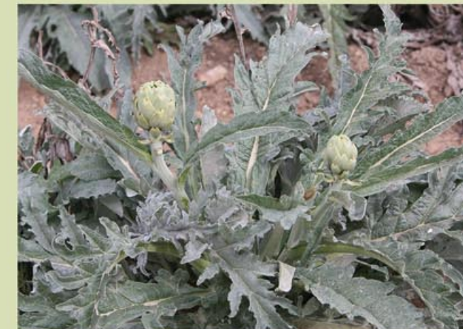
La carxofera, un dels conreus d'horta més característics que us podreu trobar a l'itinerari.